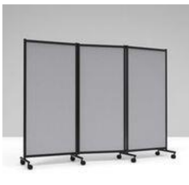
Lys Grå, trippel