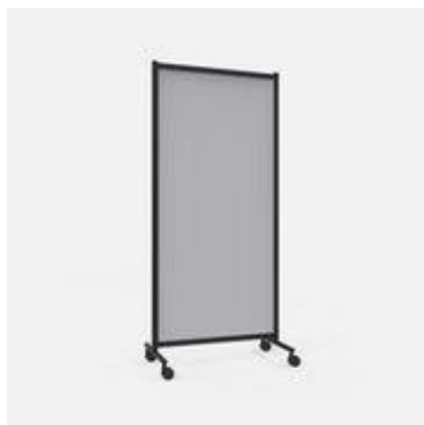
Lys Grå, enkel