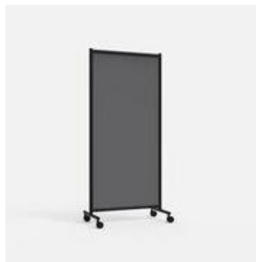
Mørk Grå, enkel