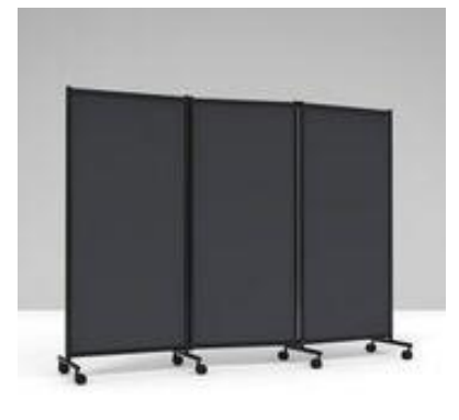
Mørk Grå, trippel